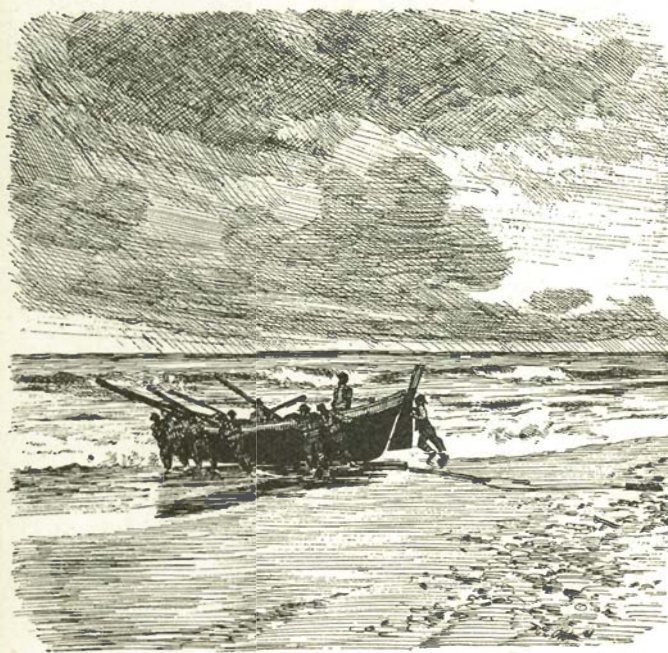
Redningsbaaden sættes ud.