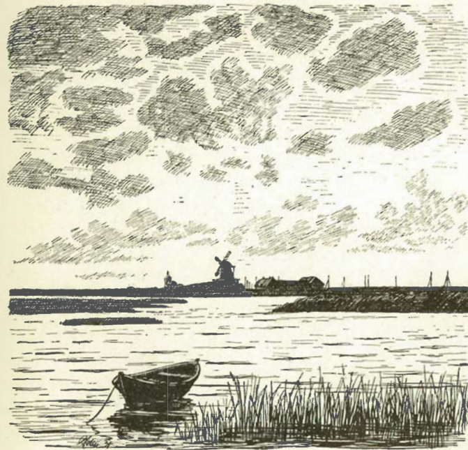
Holmslands Kirke og Mølle.