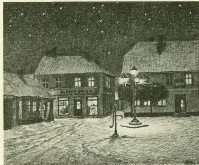
Ringkjøbing Torv omkring 1900