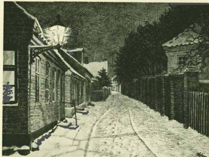
Grønnegade omkring 1900