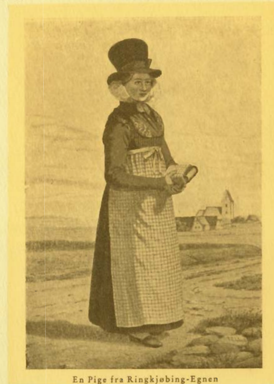
En Pige fra Ringkjøbing-Egnen

BOLLERUPS BOGHANDEL · JENS HOLM MCMXXXIV