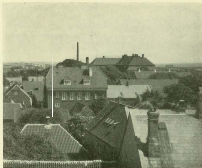
Udsigt fra Kirketaarnet — Mod Øst