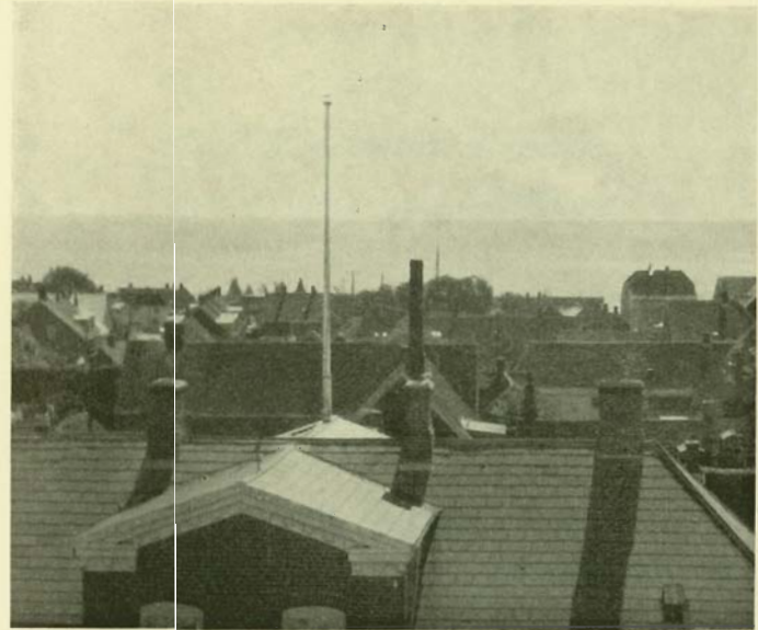
Udsigt fra Kirketaarnet — Mod Syd

Endnu er jeg Dreng, — og nu skal jeg ud at rø mig en Tur med Trykkerens Knud. Vi styrer ret ud imod Lyngvig Fyr og leger, det gaar mod Eventyr. Hejda, stræk ud, lad Baaden kun krænge, hvad rører det os, — vi er Ringkjøbing-Dreng