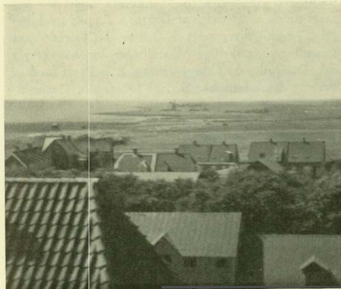
Udsigt fra Kirketaarnet — Mod Vest