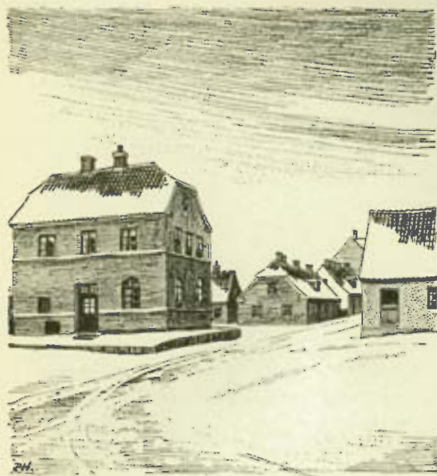
Den gamle Toldbod

Og tag dem bort kun, de slidte Sten, men alle Minder, de vil dog leve; vi ta'r dem frem i en Time sen, — det er som Duften af gamle Breve.