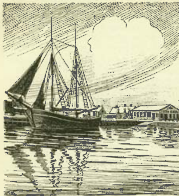
Den nye Havn