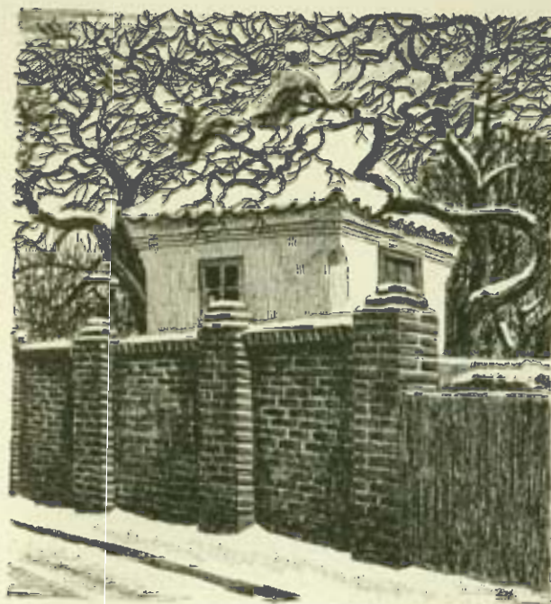
Det gamle Lysthus i Grønnegade