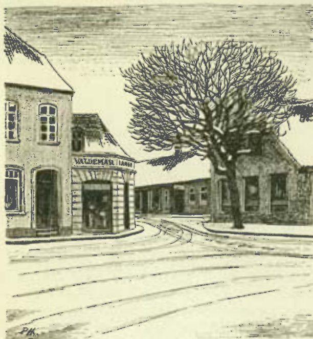
Hjørnet af Bredgade og Torvet

Fiskerflaaden er paa godt et halvt Hundrede større og mindre Motorbaade med et Dybtgaaende af ca. 7 Fod, Størrelse indtil 18 Tons. Pladsen har i Højsæsonen været saa stærkt trafikeret, at over Hundrede Fiskefartøjer samtidig har ligget i Havn og paa Red. Ved den offentlige Fiskeauktion er aarligt solgt ca. 1 Mill. kg Fisk — en enkelt Maaned godt 300,000 kg — og hertil kommer, at der yderligere er afsat betydelige Kvanta Fisk uden om Auktionen.