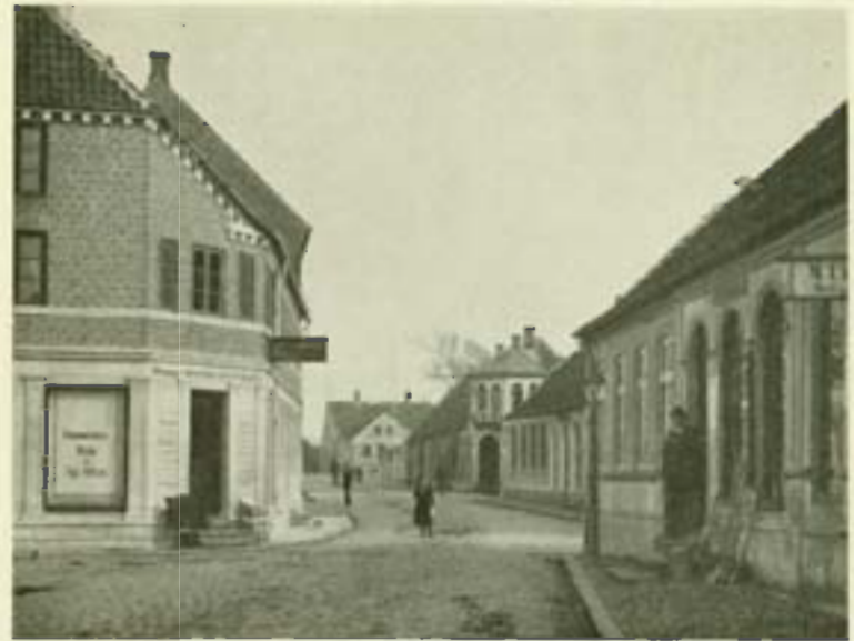
Bredgade omkring Aaret 1880.

Dansk Kvindesamfund havde den 23. Jan. arrangeret et politisk Møde paa Hotel Ringkjøbing. Der var mødt 250 Tilhørere, og det var 5 Damer, som førte Ordet, 1 fra hvert af »de fire store« Partier og 1 Kommunist. Mødet forløb i god Orden.