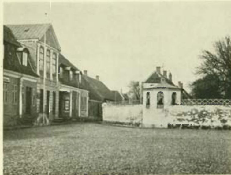
Torvet med den gamle Borgmestergaard og Præstens Lysthus omkring 1880.

Staar jeg da her paa Vonaa Bro og fylder mit Sind med Freden, mens Havet sagte nynner sin Sang, — en Strofe om Evigheden.