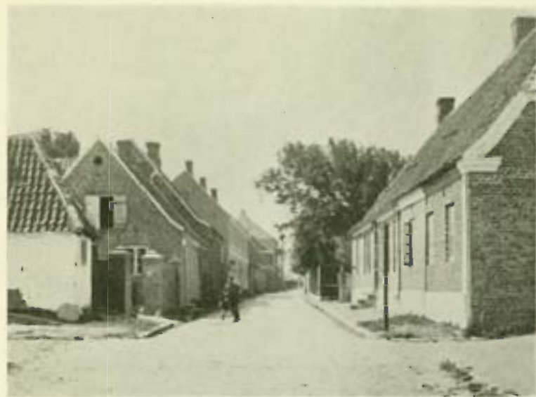
Østergade set fra Hjørnet af Chr. Hustedsvøj omkring Aaret 1880.