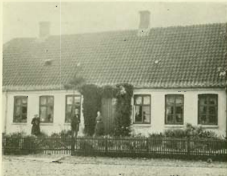
Præstegaarden omkring 1880.