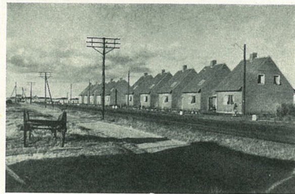
Nybygning i Ringkjøbing. Øverst »Skolevænget« og derunder Del af »Kronager«, begge opført af »Ringkjøbing Boligforening.« Nederst de ti Huse »Ringkjøbing Købstads sociale Byggeselskab« har opført paa Vester Strandsbjerg.