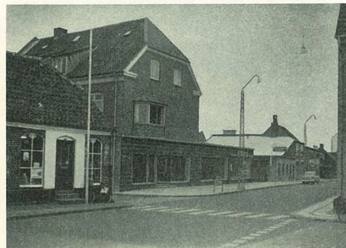
Samme hjørne med den udvidede Torvegade i dag.