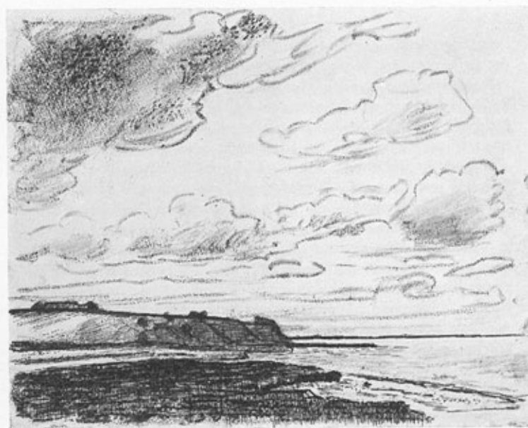
det er den danske sommer

omgang kunne jeg tænke mig at lave det på en af høj- eller landbrugsskolerne herovre, f.eks. i Velling. + 12. Den kommunale udflugt til Bovbjerg torsdag eftermiddag fik et vellykket forløb. Der deltog 182 ældre og invalidepensionister i turen, og med chauffører m. m. var det samlede selskab på ca. 225 personer, der startede fra torvet i strålende solskin. 38 virksomheder og privatpersoner havde stillet biler til rådighed, men alligevel var det nødvendigt tillige at benytte to rutebiler. + 14. Vandforsyningen er ved at undergå en ret betydelig udbygning: Den såkaldte højdebeholder på toppen af A/S Niels Jensens silo er netop taget i brug, og i slutningen af denne måned eller i begyndelsen af næste udbydes bygningen, der skal rumme det nye filteranlæg, i licitation. Dette arbejde er anslået til