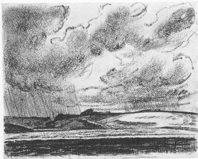
Byger som går og kommer

omgang kunne jeg tænke mig at lave det på en af høj- eller landbrugsskolerne herovre, f.eks. i Velling. + 12. Den kommunale udflugt til Bovbjerg torsdag eftermiddag fik et vellykket forløb. Der deltog 182 ældre og invalidepensionister i turen, og med chauffører m. m. var det samlede selskab på ca. 225 personer, der startede fra torvet i strålende solskin. 38 virksomheder og privatpersoner havde stillet biler til rådighed, men alligevel var det nødvendigt tillige at benytte to rutebiler. + 14. Vandforsyningen er ved at undergå en ret betydelig udbygning: Den såkaldte højdebeholder på toppen af A/S Niels Jensens silo er netop taget i brug, og i slutningen af denne måned eller i begyndelsen af næste udbydes bygningen, der skal rumme det nye filteranlæg, i licitation. Dette arbejde er anslået til