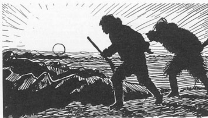
Fra grønlandsfærden 1903-04 (Tegning af Harald Moltke)