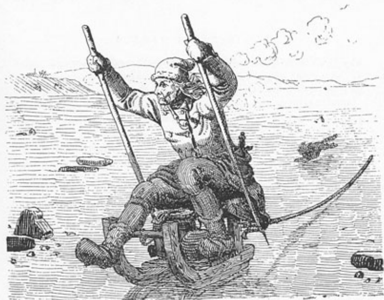
Rask stager den gamle fisker sig over isen (Chr. Dalsgaard)

Ingen havde nogen Tid set ham overdrukket. Derimod hændte det undertiden, at han gik sin sædvanlige Aftentur omkring Byen med et usikkert Fodfæste. Kom han i saadan Tilstand forbi en Baghusport, en Smuge eller Toft, hvor Byens Dreng holdt til med deres Leg, saa blev der hujet efter ham, at han tog »Dansetrin« eller »Helmusspat« eller »krydsede med Negerrom i Lasten«. Kom Drengene ham for nær, kunde han med en rask Vending og et ungdommeligt Spring sætte ind i Flokken, snubbe en og anden af Spilopmagerne og paa en egen Maade rykke ham i Tindingehaarene, saa Knægten