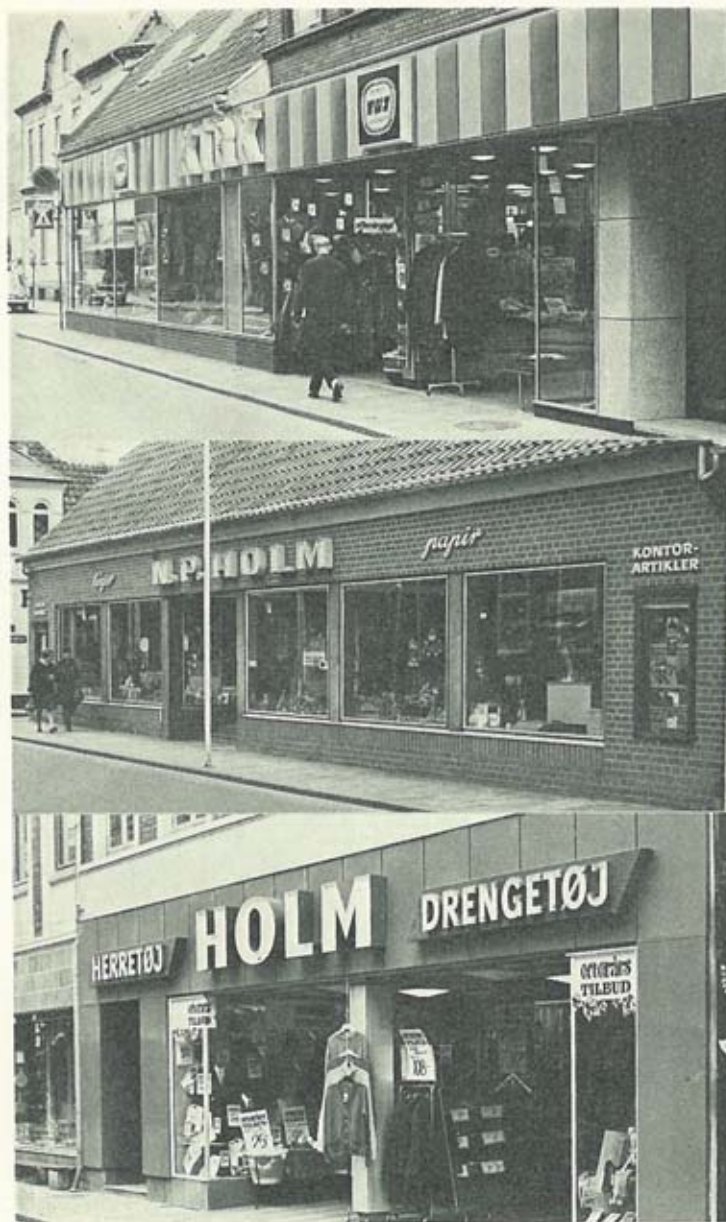
Gammelt bliver nyt.