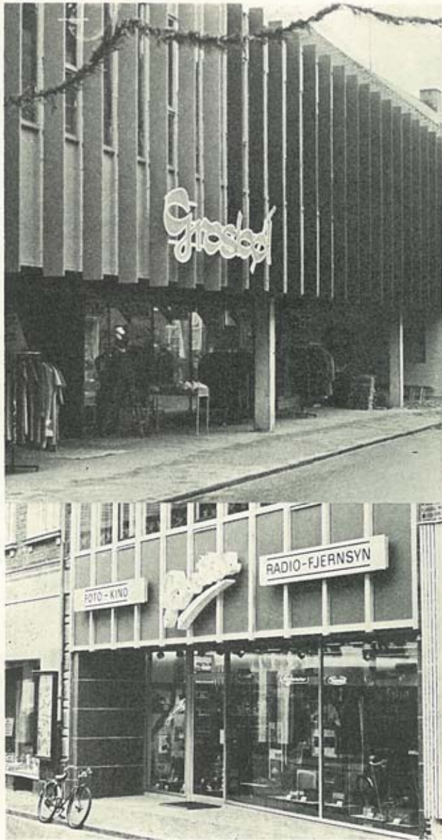
Det ny Ringkjøbing.