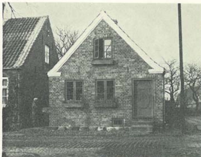
Ejendommen Vestergade 5

lægger dårlig nok mærke til, når noget ændrer sig. Men sandt at sige er en hel del huse allerede nu blevet restaureret og flere følger antagelig efter. Ejendommen Vestergade 5 med den smukke gavl beliggende skråt over for kirken og hele huset bagved er istandsat i 1966-67 og rummer nu to helt moderne lejligheder bag en smuk gavl. Dette gadeparti fra torvet til og med nævnte ejendom, Vestergade 5, er ualmindelig fint.