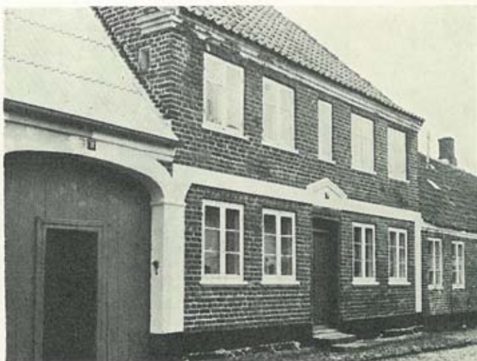
Ejendommen Øster Strandgade 13