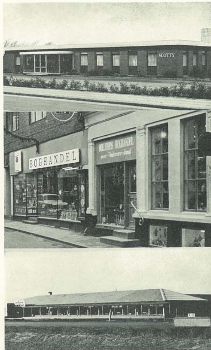
Industri og handel følges ad.

Vi kører ind mod byen og ned til havnen. Det første, der fanger øjet, er to kornsiloer. Man får det indtryk, at den lille er en kalv af den store, men dette er helt forkert. Det er den lille, der er »moderen« og den store, der er »barnet«. Sammen