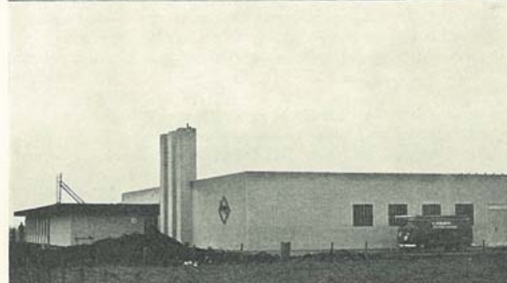
Frødamme med ny industri.