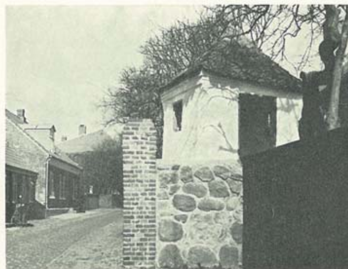
Den lille pavillon i Grønnegade

Vi må håbe og ønske at Jydsk Telefon-Aktieselskab, som