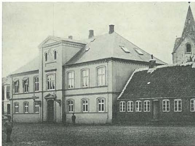
Det nuværende rådhus, bygget 1849.

Man vil heraf kunne forstå, at den vestligste del af det nuværende rådhus ligger på de gamles plads, hvorimod den østligste del ligger på ny grund. Endvidere kan bemærkes den gamle, skrå indgang fra torvet til Kirken, omtrent hele kvistpartiets plads på rådhuset. Man ser let i dag, at ved at flytte rådhuset disse alen mod øst, er det