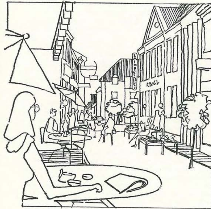
Et utraditionelt udkast til gågaden i Ringkjøbing af arkitekt Niels Vium Jensen.