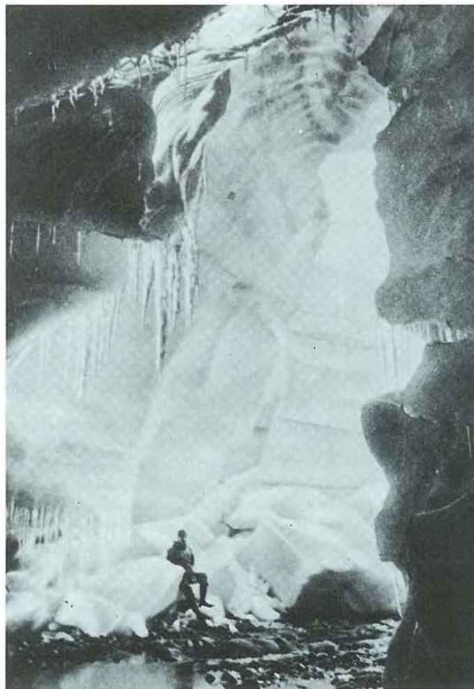
Den store ishule »Gripahulen« nær »Danmark«s havn.

Den 19. april 1904 vendte ekspeditionen hjem. Mange opgaver var gennemført. Bopladser, fjorde, fjælde og isbræer var blevet hjemsogt og venskab og samarbejde med kolonibestyrer og eskimofamilier var blevet knyttet. Meget mere om de mange opgaver ekspeditionen fik løst burde have været med her.