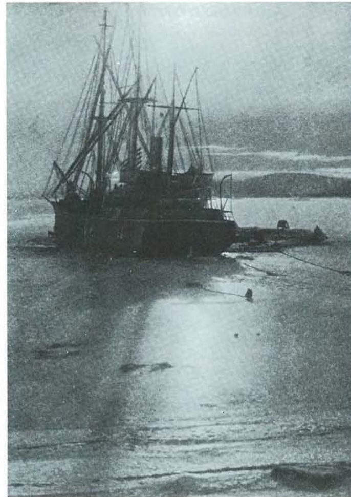
Ekspeditionsskibet »Danmark« indefrosset i sit vinterkvarter 1906.