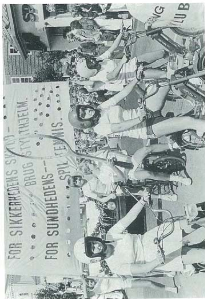
Fra vognoptoget ved Fjordfesten.