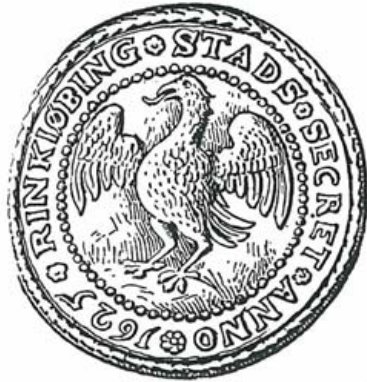
Et af byens segl – 1625.

Hvem nævnte Kong Valdemar er, ved man ikke med sikkerhed. Der er tidligere gættet paa Valdemar den Store eller Valdemar Sejir, men det er mere sandsynligt at det drejer sig om Valdemar Atterdag, eller den sønderjydske hertug Valdemar, der var dansk konge fra 1326-30, altsaa netop omkring den tid Ringkøbing omtales for første gang.