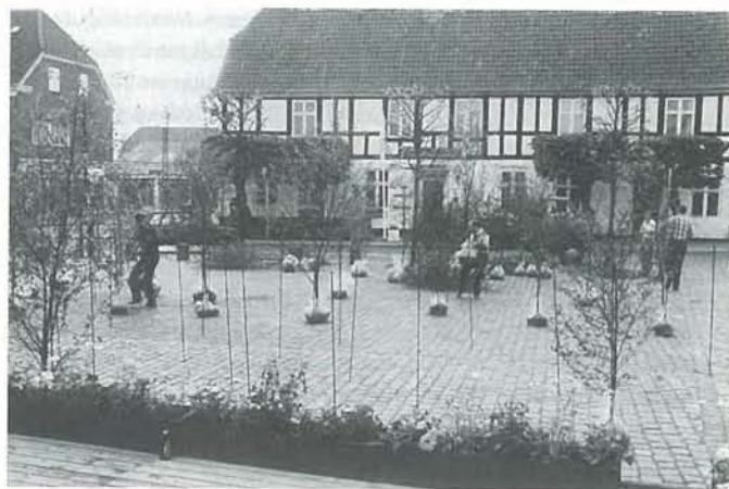
Handelsforeningens PR-udvalg »plantede» en birkeskov på Torvet.