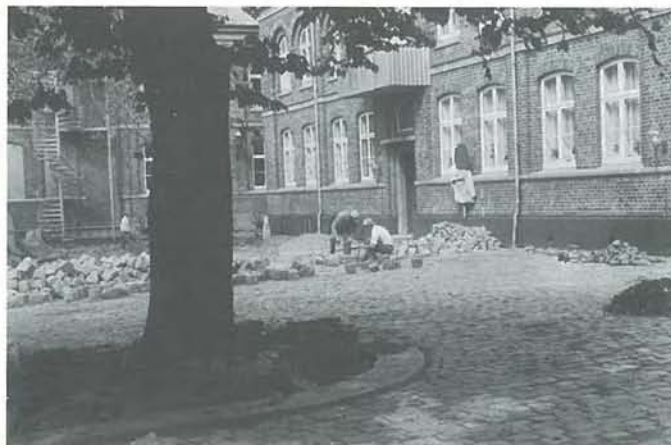
Kirkepladsen får i denne tid ny brolægning.