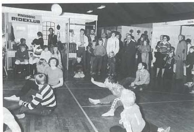
Lions Club havde stor succes med Handicap-messen i ROFI-Hallen. Der var også volleyball på programmet.