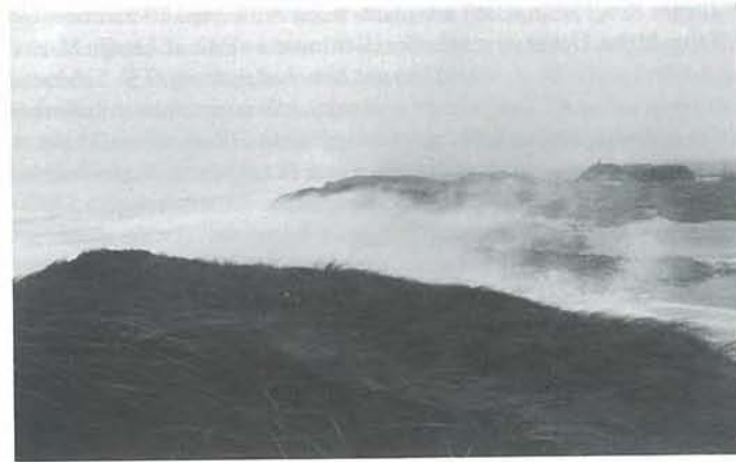
Den orkanagtige storm skabte ødelæggelser for millionbeløb. Her er havet på vej igennem klitterne ved Husby.