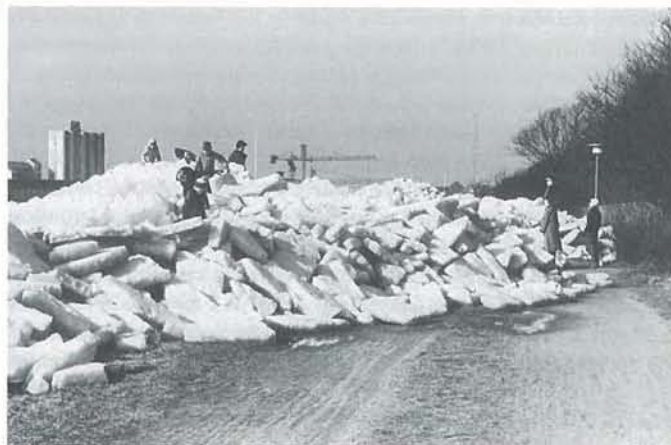
Isskruningerne på Fjordstien.