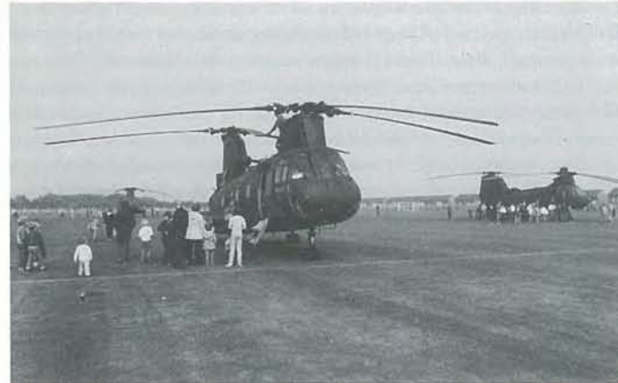
Navnlig for børnene var det den helt store oplevelse, da 5 helikoptere landede på stadion.

flere kvindelige skytter optaget i foreningen. * 8. SodaStream ApS lancerer i disse dage et par nye produkter, som der næres store forhåbninger til. Den ene serie omfatter Ringkjøbing Solbær, Ringkjøbing Kirsebær og appelsiner. På etiketten, der er blå, står der: Ringkjøbing-serien, »gammeldags« kvalitet og smag. For hele serien gælder det, at den egner sig til blanding med såvel vand som mælk og som kold eller varm drik. Den anden serie henvender sig til folk, der er kalorietællere og diabetikere. Der er 4 varianter og fra de 3 er alle farvestoffer fjernet. Der er brugt helt naturlige aromastoffer og ægte frugtsagt. Denne series navn er »Kalorie 5«. * Til Teaterforeningens sæson har 210 tegnet abonnement. Der er således kun 13 billetter tilbage til løssalg. Dette er beklageligt, men der er glæde over den stigende teaterinteresse. * 9. Byrådet frigav 143.000 kr. til opførelse af det nye murede cykelskur ved Rådhuset. Projektet er blevet noget dyrere end beregnet, da grunden skal piloteres. * På byrådsmødet blev der nedsat et skolebiblioteksudvalg. * Ringkjøbing Banks byggeri på hjørnet af Algade/Mellemgade har været forelagt byrådet. Flere gav positiv tilslutning til