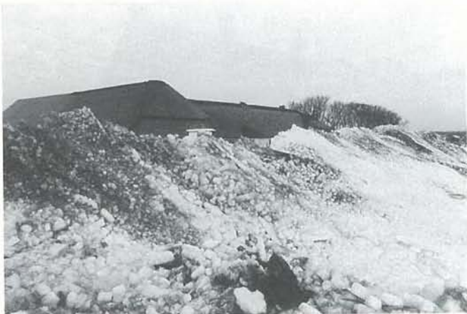
Da isskruningerne ramte Ringkjøbing. Denne gamle stråtækte gård ligger i Gl. Sogn og var tæt på at blive jævnet med jorden af ismasserne.