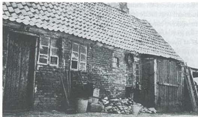
Ringkjøbing Søndagsskole omkring 1884.