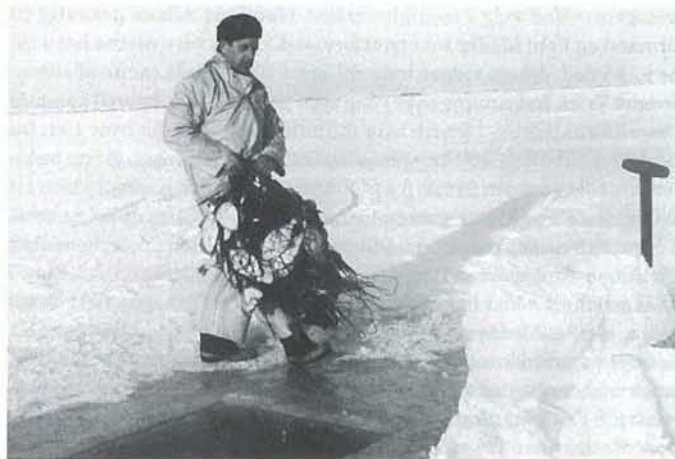
Isen ingen hindring for fiskeriet.