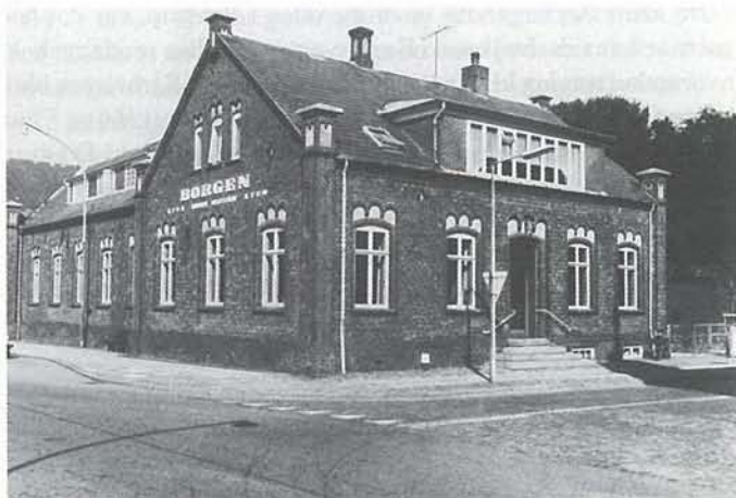
Søndagsskolens samlingssted i dag er Borgen i Nygade.

dagsskolen her, og vi tror, at den gode sæd, der er blevet sået – Guds ord – har fundet grobund og har båret frugt til Guds ære, og vi ønsker Ringkjøbing Søndagsskole til lykke med de 100 år ønsker fortsat Guds rige velsignelse over gerningen.