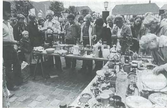
Antik-messen på Torvet var en succes. De gamle ting blev nøje studeret.