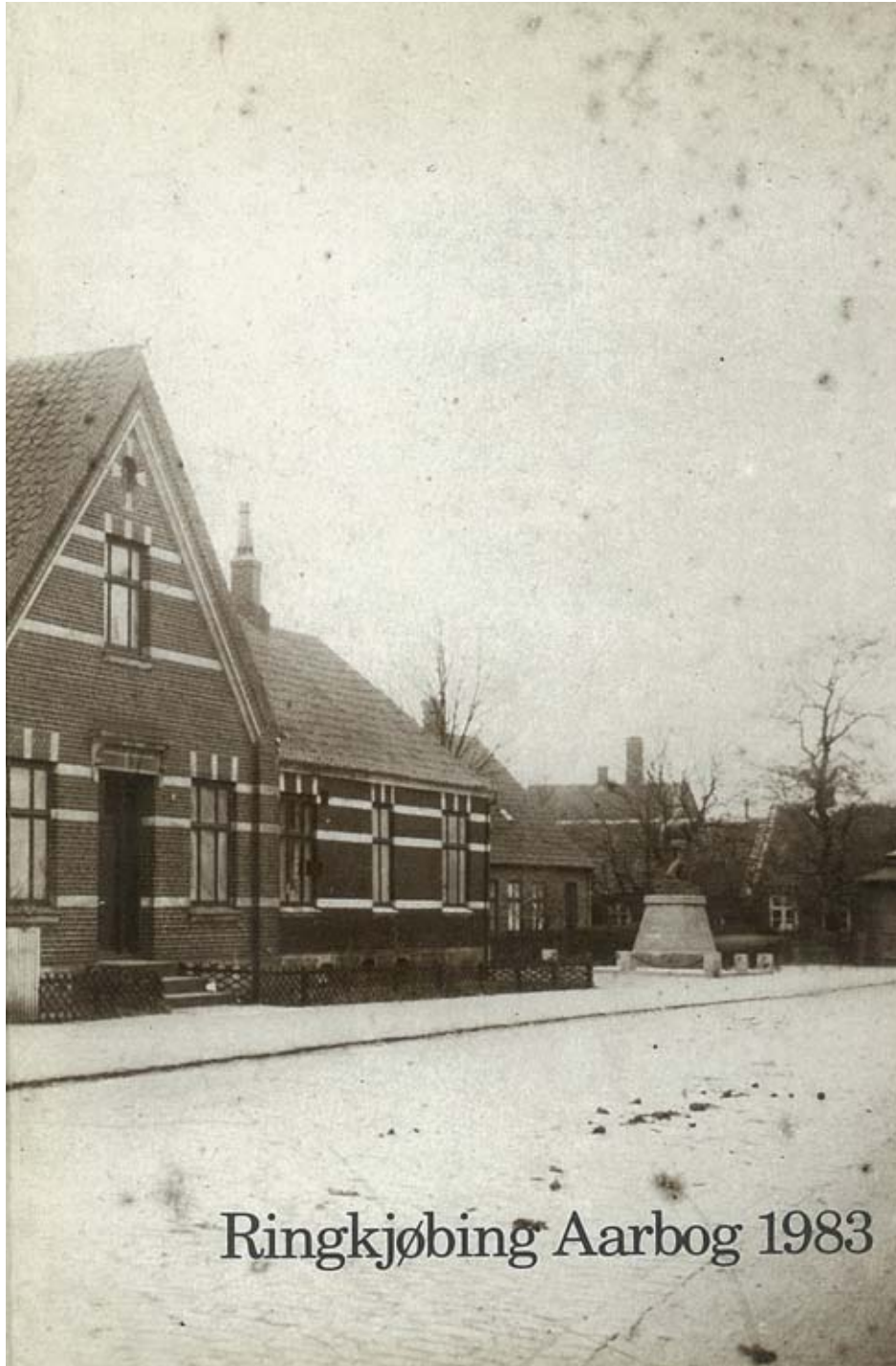
Ringkjøbing Aarbog 1983