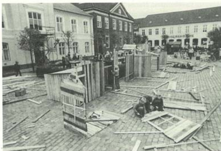
I efterårsferien havde Handelsforeningen arrangeret »børnebyggeri« på Torvet.