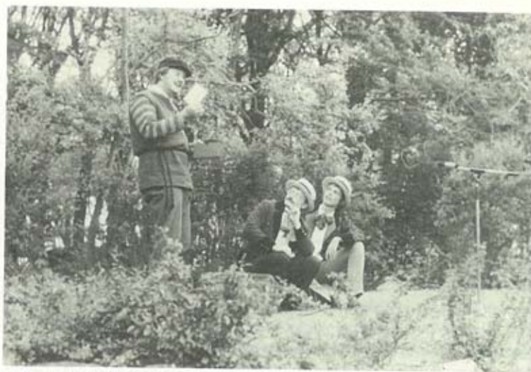
Friluftsspil i Alkjær Lukke.