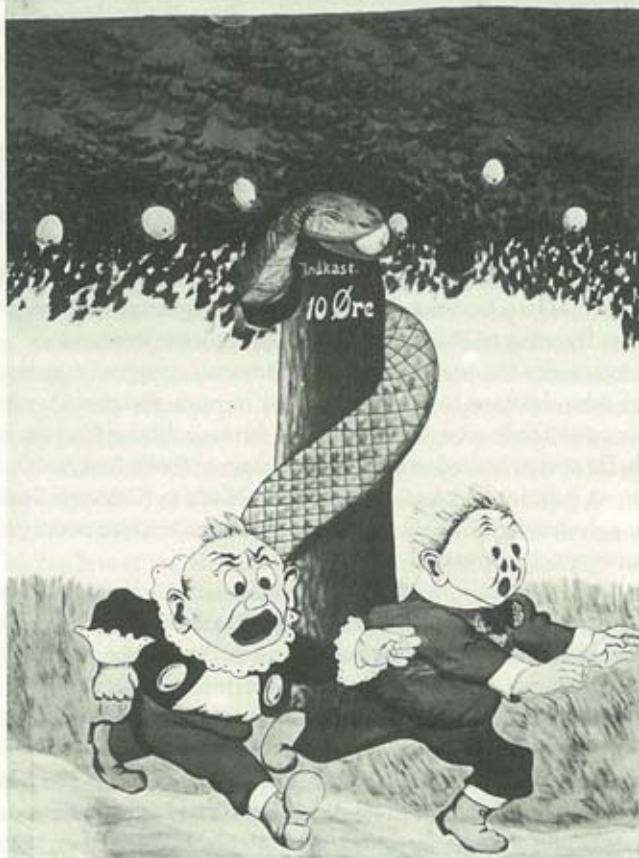
Efter møntindkast viser en handskeslange sig med et æble i munden. Frugtautomaten var i brug igen ved jubilæet i 1983. På grund af inflationen siden 1912 var 10-øren dog afløst af en 5-krone.

lig formentlig vil være en Betingelse for Ydelse af Statstilskud, at der allerede er tilvejebragt en ikke ubetydelig Samling, vedtoges det ikke i Aar at indgive saadant Andragende.»