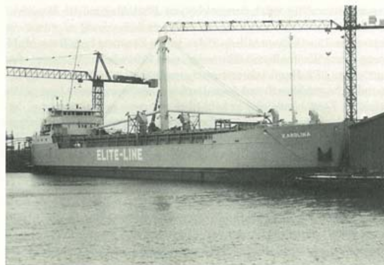
En af Nordsøværftets mange nybygninger.