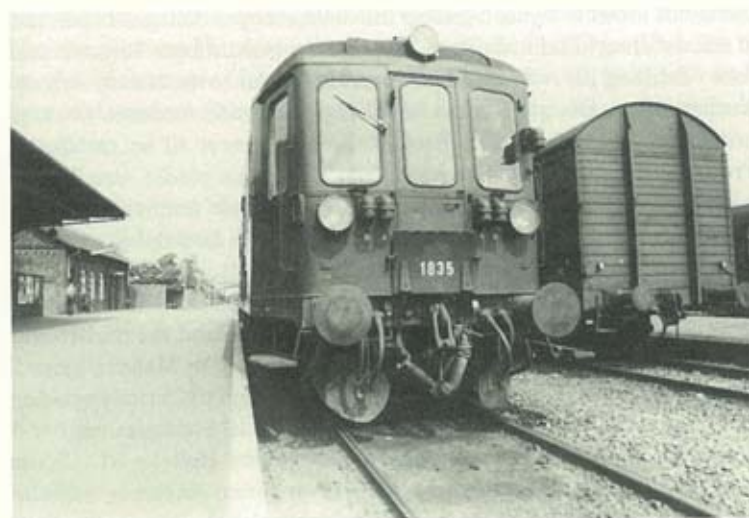
Den sidste af de gamle MO-vogne forlader Ringkjøbing station.