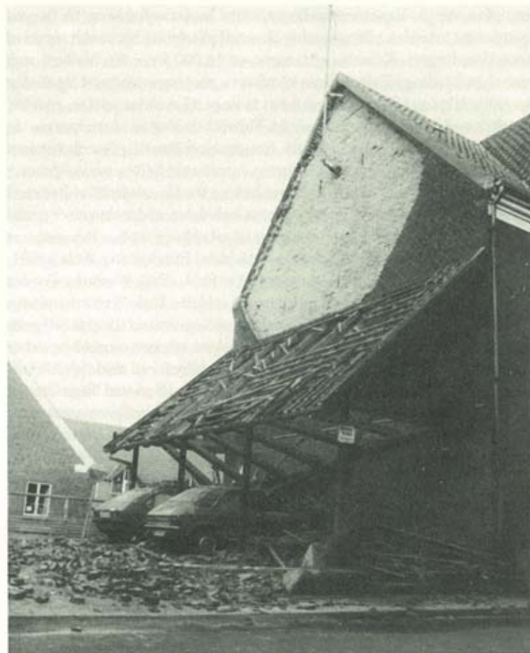
I Vestergade væltede denne gavl under den kraftige storm i januar.

Formanden opfordrede alle til at være med i »Plant-et-træ«-kampagnen. • To kvinder holder bibeltimer på Højskolehotellet. De tilhører ikke nogen sekt, må vel nærmest betegnes som lægprædikanter. Vi vil gå med evangeliet fra sted til sted og give Guds tanker videre, er deres motto. • Ved licitationen over trykning af Trafikselskabet Ringkjøbing Amts