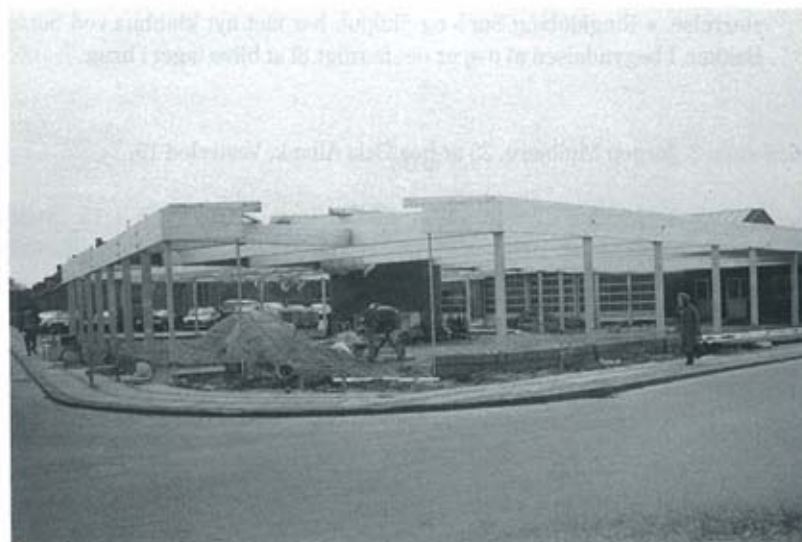
RAF-biler på Herningvej under ombygningen.