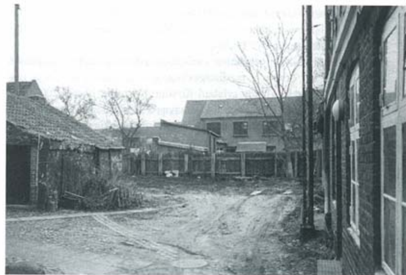
Gården bag Bollerups Boghandel, hvor der skal bygges lejlighed og butik.